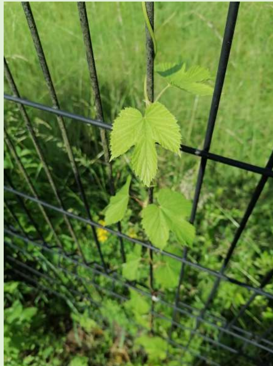
Houblon grimpant sur le grillage