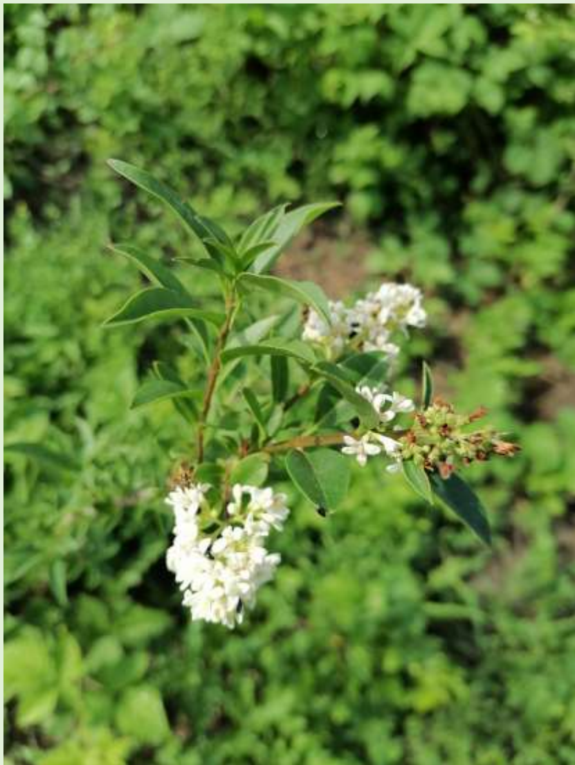
Troène en fleur