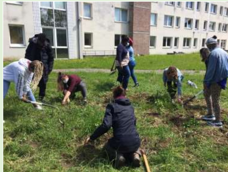
Il a fallu désherber...