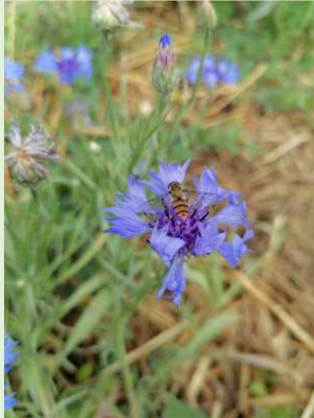
Bleuet et son syrphide