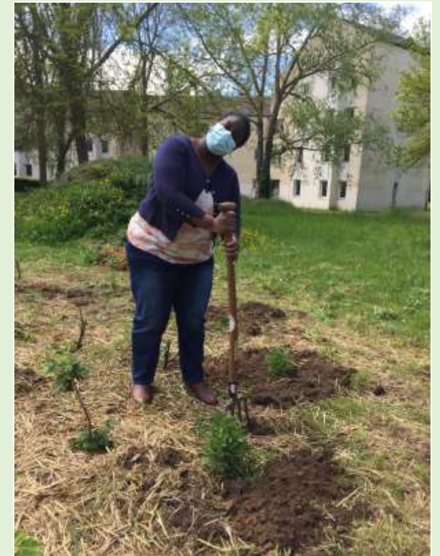
... Avant de replanter et de pailler les espaces !