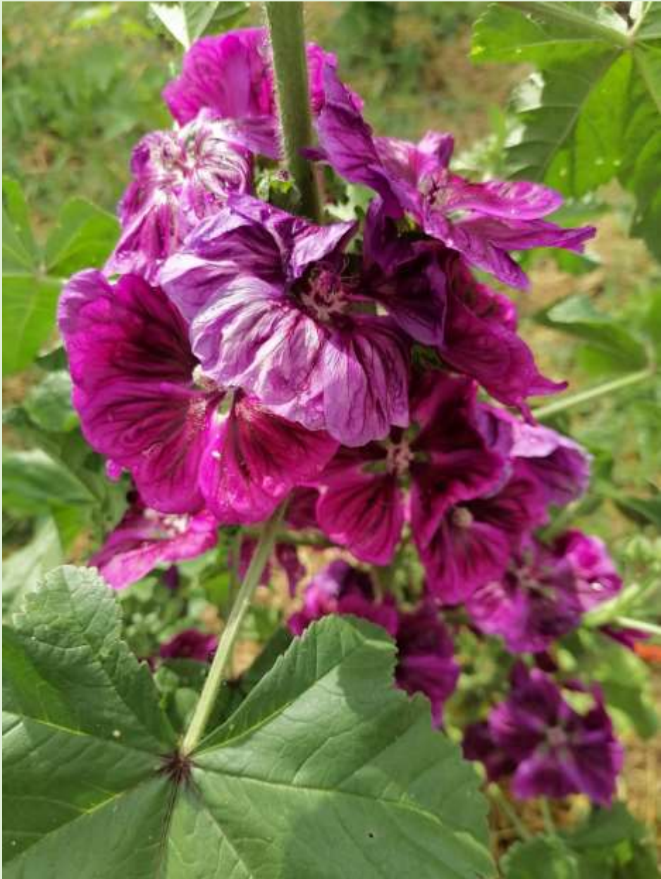
Mauve en fleur