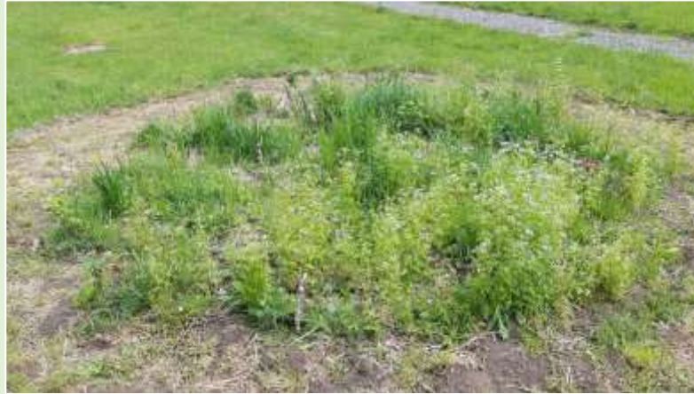
Les « mauvaises herbes » avaient envahi les carrés à aromatiques.